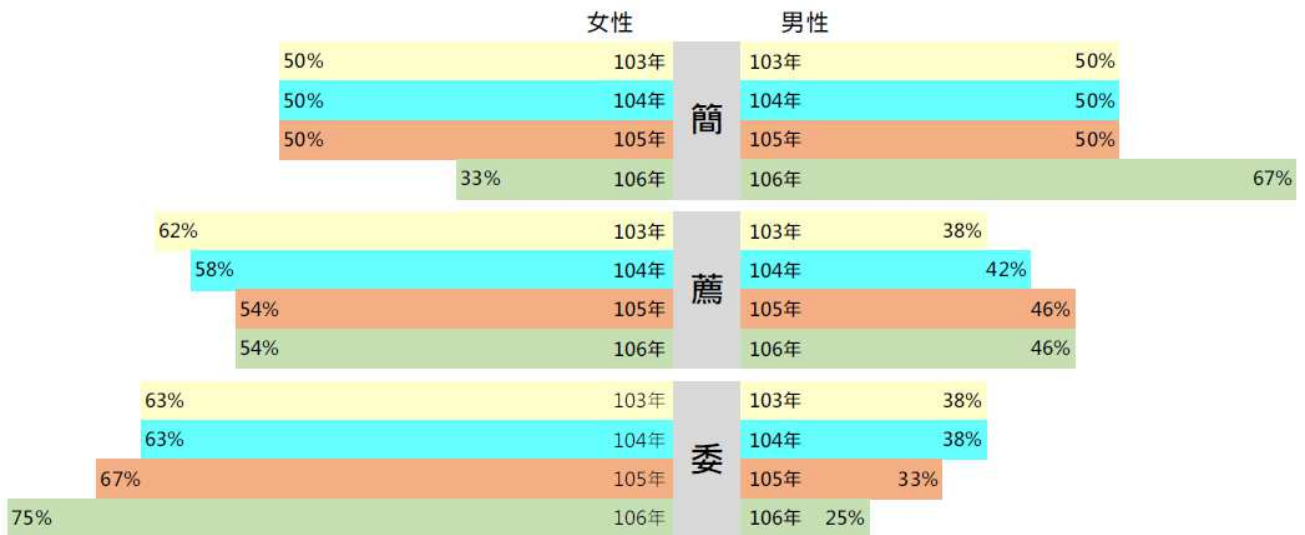
圖二：本府研考會 103-106 年現有職員官等性別比例（小數點四捨五入）